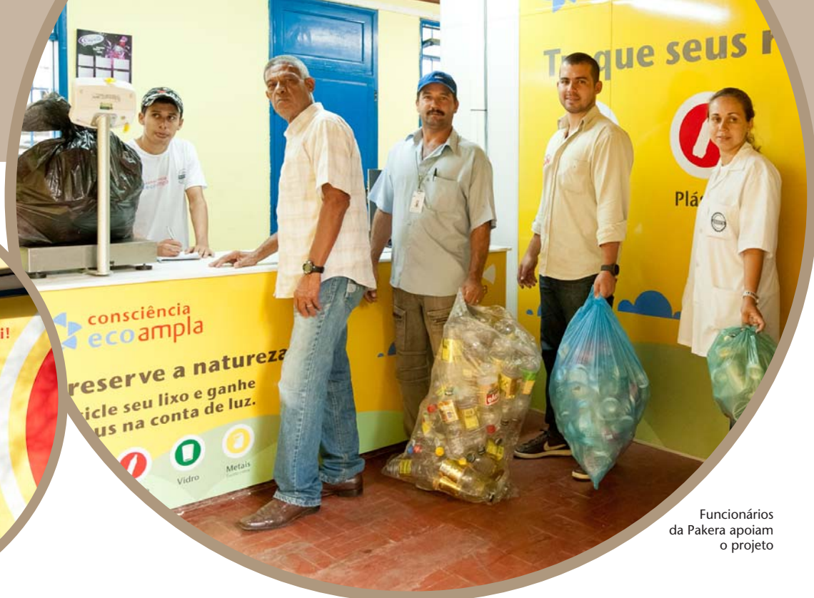
Funcionários da Pakera apoiam o projeto